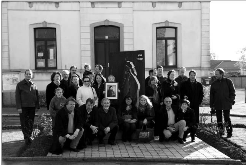
Het internationaal gezelschap rond het monument van Splingaerd.