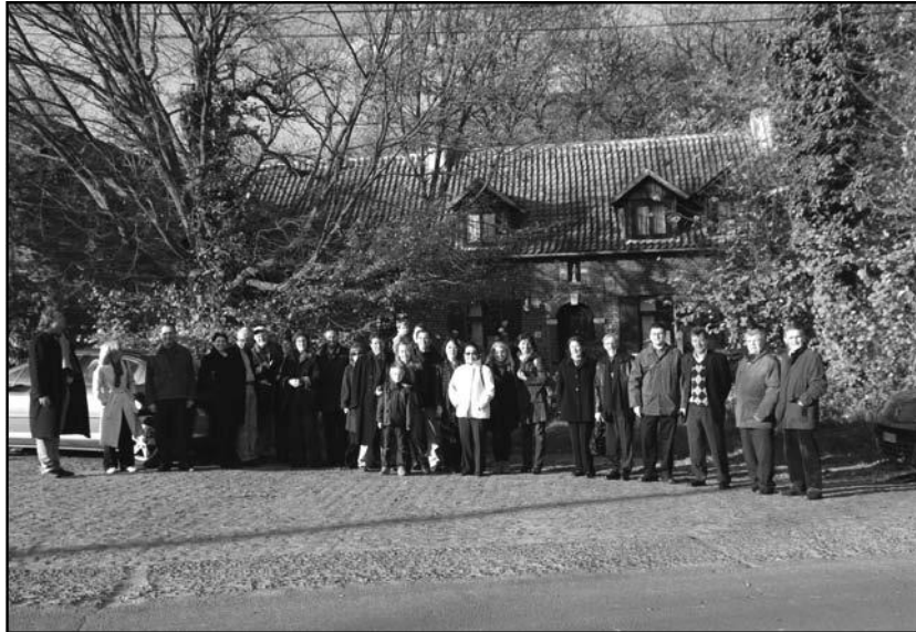
Ook de hoeve Vandeput op de hoek van de Forival- en de Bergstraat genoot de aandacht van de bezoekers.